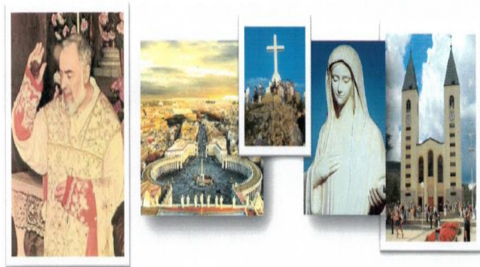
MEDJUGORIE - MATKA BOŻA KRÓLOWA POKOJU

Zapraszamy! Więcej szczegółów i informacji: Blue Amber Travel: (847)630-3777.