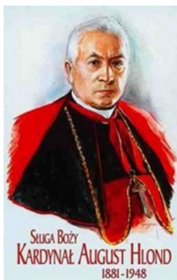
SŁUGA BOŻY KARDYNAŁ AUGUST HLOND 1881 - 1948

Boże, nasz Ojciec, dziękuję Ci za to, że dałeś naszej Ojczyźnie kard. Augusta Hlonda, biskupa i Prymasa Polski, wielkiego i żarliwego czciciela Niepokalanej Dziewicy, Matki Twojego Syna i naszej Matki oraz, że uczyniłeś go troskliwym ojcem i opiekunem Polonii zagranicznej. Racz wzbudzić i w moim sercu gorącą miłość ku Tobie i synowską cześć ku Maryi Wspomożycielce Wiernych, a dla wstawienia Twojego Imienia racz mi udzielić za wstawiennictwem sługi Bożego kard. Augusta Hlonda łaski, o którą pokornie proszę. Amen.