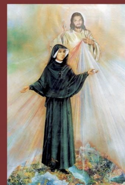
Święta s. M. Faustyna Kowalska

Kiedy weszłam do swej samotni - usłyszałam te słowa: Każdą duszę bronię w godzinie śmierci, jako swej chwały, która odmawiać będzie tę koronkę albo przy konającym inni odmówią - jednak odpustu tego samego dostępują. Kiedy przy konającym odmawiają tę koronkę, uśmierza się gniew Boży, a miłosierdzie niezgłębione ogarnia duszę, i porusza się wnętrze miłosierdzia Mojego, dla bolesnej męki Syna Mojego. O, gdyby wszyscy poznali, jak wielkie jest miłosierdzie Pańskie, ale jak bardzo my wszyscy potrzebujemy tego miłosierdzia, a szczególnie w tej stanowczej godzinie. (811)