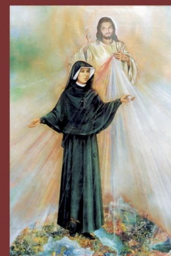
Święta s. M. Faustyna Kowalska

Kiedy się tak modliłam, nagle uczułam jakby szarpnięcie całym organizmem i uczułam się nagle zdrowa. Oddech mam czysty, jakbym nigdy na płuca nie chorowała, i bólu nie czuję, a to mi jest znak, że mam przystąpić do dzieła. (1089)