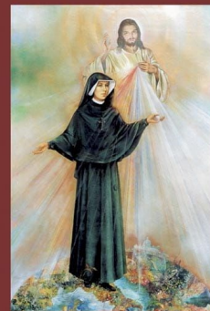
Święta s. M. Faustyna Kowalska

Czuję, że jestem wielka, kiedy jestem zjednoczona z Bogiem. Co za szczęście mieć świadomość Boga w sercu i żyć w ścisłej z Nim zażyłości. (1133-1135)