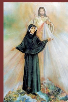
Święta s. M. Faustyna Kowalska

Kiedy się wpatrzyłam w to Serce Najświętsze, wyszły te same promienie - jakie są w tym obrazie - jako krew i woda, i zrozumiałam, jak wielkie jest miłosierdzie Pańskie. - I znów rzekł Jezus łaskawie: Córko Moja, mów kapłanom o tym niepojętym miłosierdziu Moim. Pałaj Mnie płomieniem miłosierdzia, chcę je wylewać na dusze, ale nie chcą dusze wierzyć w Moją dobroć. Nagle Jezus znikł. Jednak dzień cały duch mój był zanurzony w odczuwalnej obecności Bożej, pomimo gwaru i rozmowy, jaka zwykle bywa po rekolekcjach. Nic mi to nie przeszkadzało. Duch mój był w Bogu, pomimo że na zewnątrz brałam udział w rozmowach. (177)