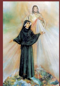
Święta s. M. Faustyna Kowalska

Dziękuję Bogu za tę chorobę i niedomagania fizyczne, bo mam czas na rozmowę z Panem Jezusem. Rozkoszą moją jest spędzać u stóp Boga utajonego długie chwile, a godziny przesuwać mi się jako minuty, nie wiadomo kiedy. Czuję, że pali się we mnie żar i nie rozumiem innego życia prócz ofiary, która płynie z czystej miłości. (779. 781.784)